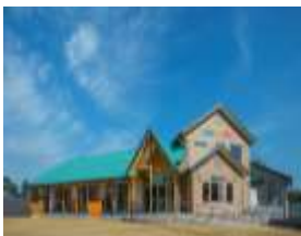
高浜キッズこども園

町内の保育所・認定こども園は、公立認定こども園が1ヵ所、私立認定こども園が1ヵ所、公立保育所が3ヵ所です。